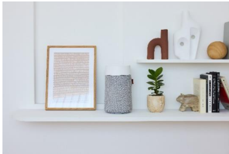
＜同封カラー＞ ストックホルムフォググレー

さらに、スウェーデンの大自然にインスピレーションを得た温かみのある 2 色のカラー展開をご用意。プレフィルターは着せ替え可能で気分に合わせて色を変えたり、洗い替えとして別色を用意しておくことでコーディネートのお楽しみも広がります。