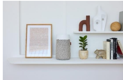
＜別売カラー＞ ライムストーンベージュ